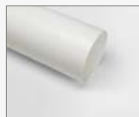
Ø150x500 mm KIT0120996