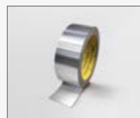
50 mm x 25 m KIT0161453