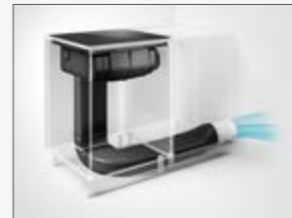
Esempio di installazione Example of installation