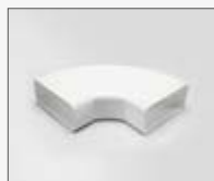
90° 227x288x94mm KIT0121004