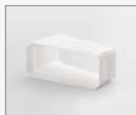
15° 227x138x94 KIT0121002