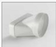
227x94 - Ø153mm KIT0121008