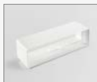
223x59x72 mm KIT0121015