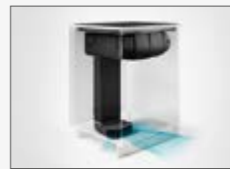
Installazione "PLINTH IN" Installation "PLINTH IN"

Elica has designed 3 different kits to convert the product to the filtering mode, to be used according to installation needs.