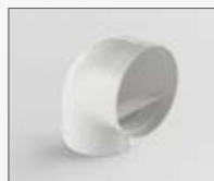
90° - Ø157 KIT0121006