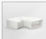
227x94x190/560 mm KIT0126810