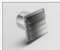
190x190 - Ø147mm KIT0121010