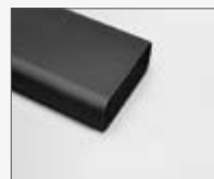
222x89x500 mm KIT0173527