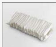
218x55x190/590 mm KIT0121017