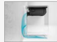
Installazione "BACK OUTLET" Installation "BACK OUTLET"