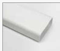
218x55x1000 mm KIT0121013