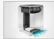
Installazione "PLINTH OUT" Installation "PLINTH OUT"