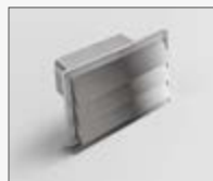
int 216x82 est 290x160 mm KIT0121009