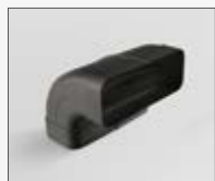
90° 227x94mm KIT0121005