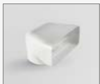
227x94 - Ø146mm KIT0121007