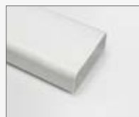
222x89x1000 mm KIT0120991

ACCESSORY PIPE FITTINGS FOR DUCT-OUT VERSION