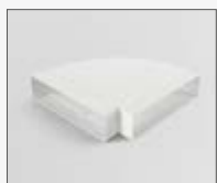
90° 218x55 mm KIT0121016