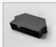
Deflettore sotto zoccolo Deflector under plinth KIT0168750